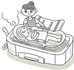
きかいよく 機械浴