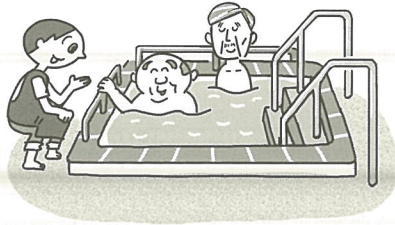
いっばんよく 一般浴