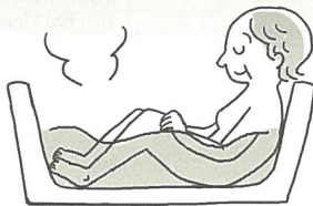
はんしんよく 半身浴