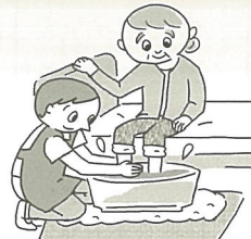
ぶぶんよく / そくよく 部分浴 / 足浴